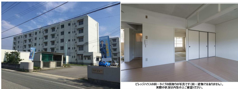
ビレッジハウスの同一タイプの図取りの写真です（同一建物ではありません）。 実際の状況は内覧の上にご確認ください。

ショッピングモールに隣接し徒歩1分と生活環境良好 仲介手数料無料！（貸主負担）カギ交換代無料！